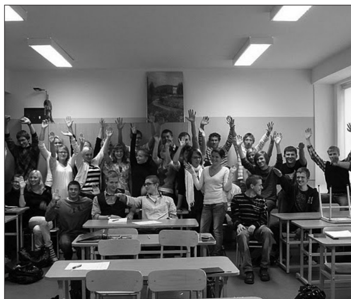
12. c osaleb üleilmses kampaanias

17.-19. september toimus üle maailma erinevates kohtades kampaania Stand Against Poverty (Seisame vaesuse vastu), mille eesmärgiks