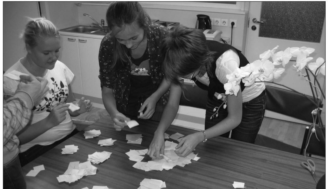
Õpilasesinduse liikmed hääli lugemas

Aeg lendab linnutiivul. Juba pool septembrist on mööda läinud ja loodetavasti olete juba käesolevasse kooliaastasse sisse elanud.