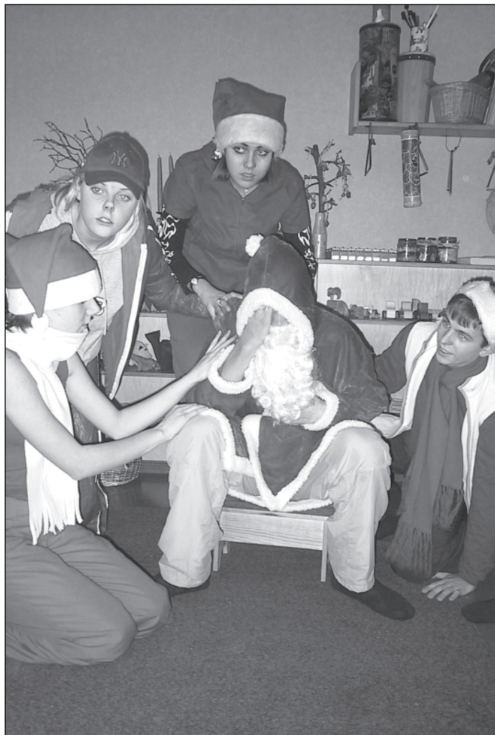
Päkapikud jõuluvana muhku ravimas. 10. c klassi etendus lasteaias Kõige Suurem Sõber.

Pakkumine tuli eralasteaiast Kõige Suurem Sõber. Ja 13. detsembri keskpäeval hakkaski KG-st läbi lume kuhugi pargi poole (keegi ei saanud täpselt aru, kus lasteaed asub) rühkima päris mitmepealine seltskond.