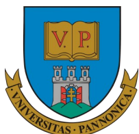
University of Pannonia www.uni-pannon.hu