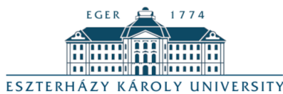
Eszterházy Károly University https://uni-eszterhazy.hu/